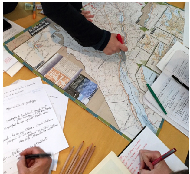
Workshop à la MAQ