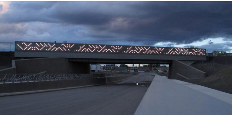
Pont ferroviaire, campus Outremont