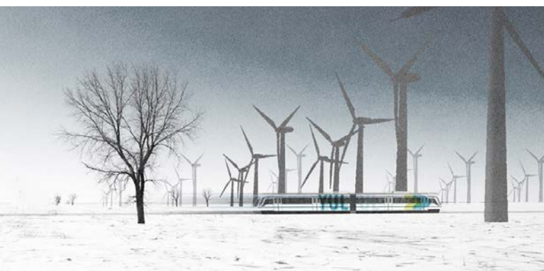
YUL : MTL Paysages en mouvement