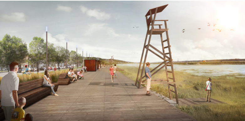
Mise en valeur du littoral Est et de ses abords, Québec