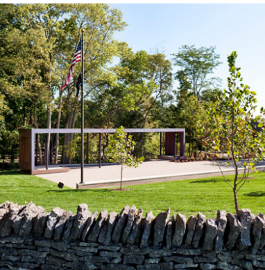
Grounds of Remembrance