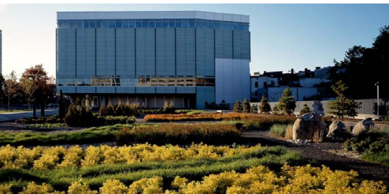
Jardin de la Grande bibliothèque du Québec

Philippe Lupien, architecte et architecte paysagiste