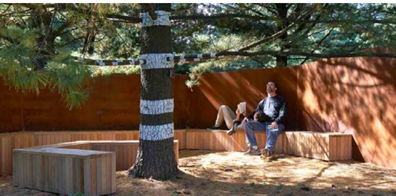
Arboretum